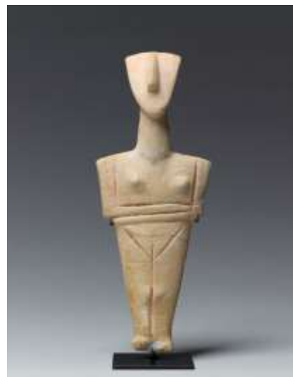
Idole cycladique aux bras croisés, 2700 - 2300 avant J.-C., marbre