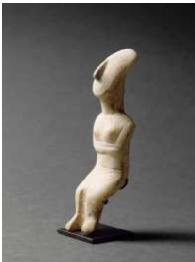
Figure féminine assise, 2700 - 2300 avant J.-C., marbre