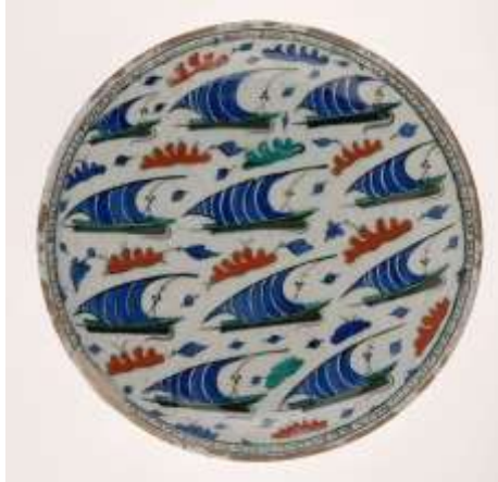
Plat aux bateaux, 16 ème siècle, céramique, salle 186