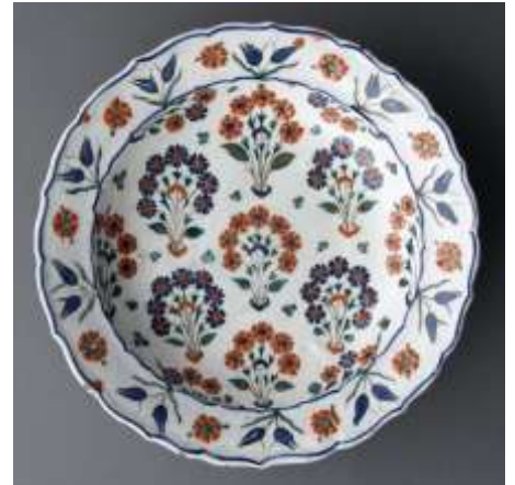
Plat aux sept bouquets, 16 ème siècle, céramique, salle 186