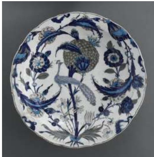
Plat au paon, vers 1550, céramique, salle 186

Le Plat au paon est une céramique de l'époque ottomane du 16 e siècle. Il a été réalisé en Turquie. Il fait partie de la collection des arts de l'Islam. Ce plat est uniquement décoratif, personne ne mangeait dedans. L'élément principal de l'assiette est le paon. Il se perd dans un univers végétal composé de longues feuilles courbes, dentelées et de fleurs variées, réelles ou imaginaires.