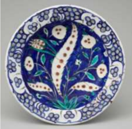
Plat au bouquet de tulipes et de grenade, 16 ème siècle, céramique, salle 186

Tu peux créer ta propre collection d'assiettes murales en changeant de modèle d'assiette et de couleur de support cartonné. Quelques suggestions d'œuvres :